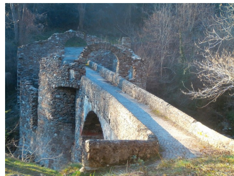
Le pont du Diable à Montoulieu

Le parcours sur Edp : 197155 – 54,9 km, D+ 1216 m