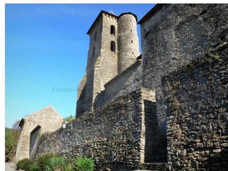
Le prieuré de Camon

Le parcours sur Edp : 197186 – 59,1 km, D+ 614 m