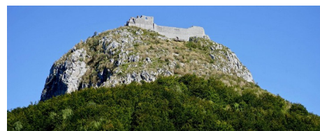
Le château de Montségur

Le parcours sur Edp : 197146 – 60,1 km, D+ 1016 m