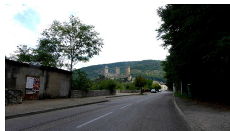
Le château de Foix (VSO le 15/09/2018)

Le parcours sur Edp : 197149 – 53,4 km, D+ 918 m